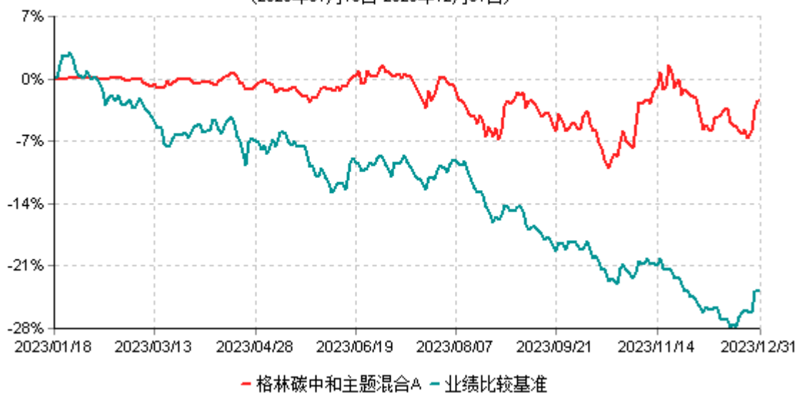
格林碳中和主题混合A累计净值增长率与业绩比较基准收益率历史走势对比图 (2023年01月18日-2023年12月31日)