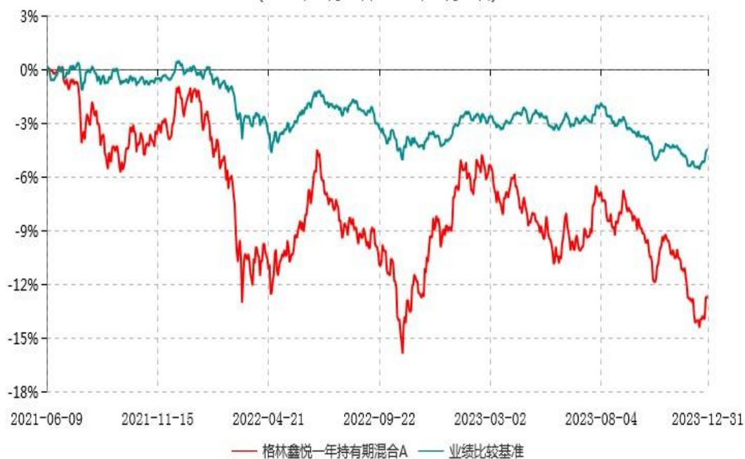
格林鑫悦一年持有期混合A累计净值增长率与业绩比较基准收益率历史走势对比图 (2021年06月09日-2023年12月31日)