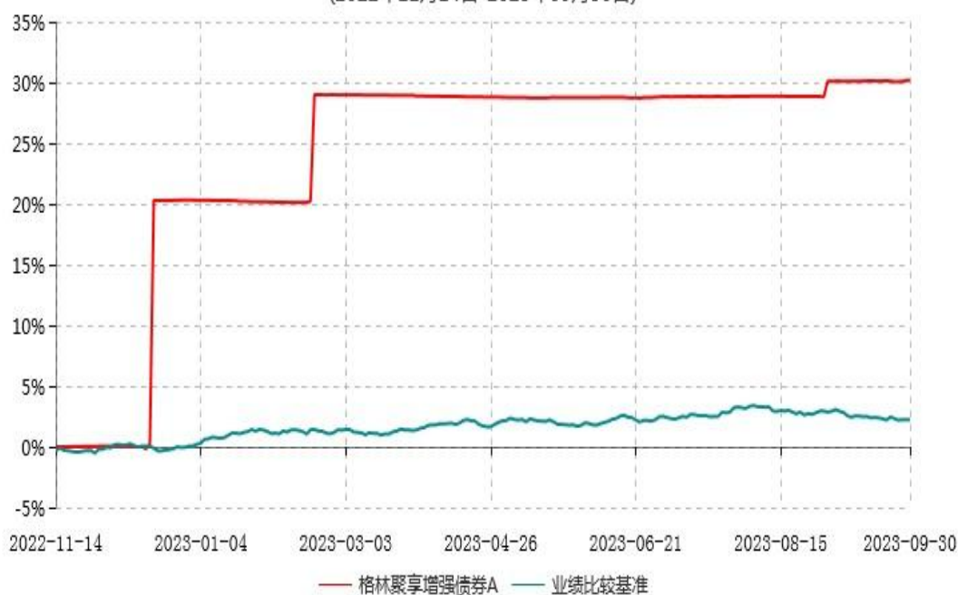
格林聚享增强债券A累计净值增长率与业绩比较基准收益率历史走势对比图 (2022年11月14日-2023年09月30日)