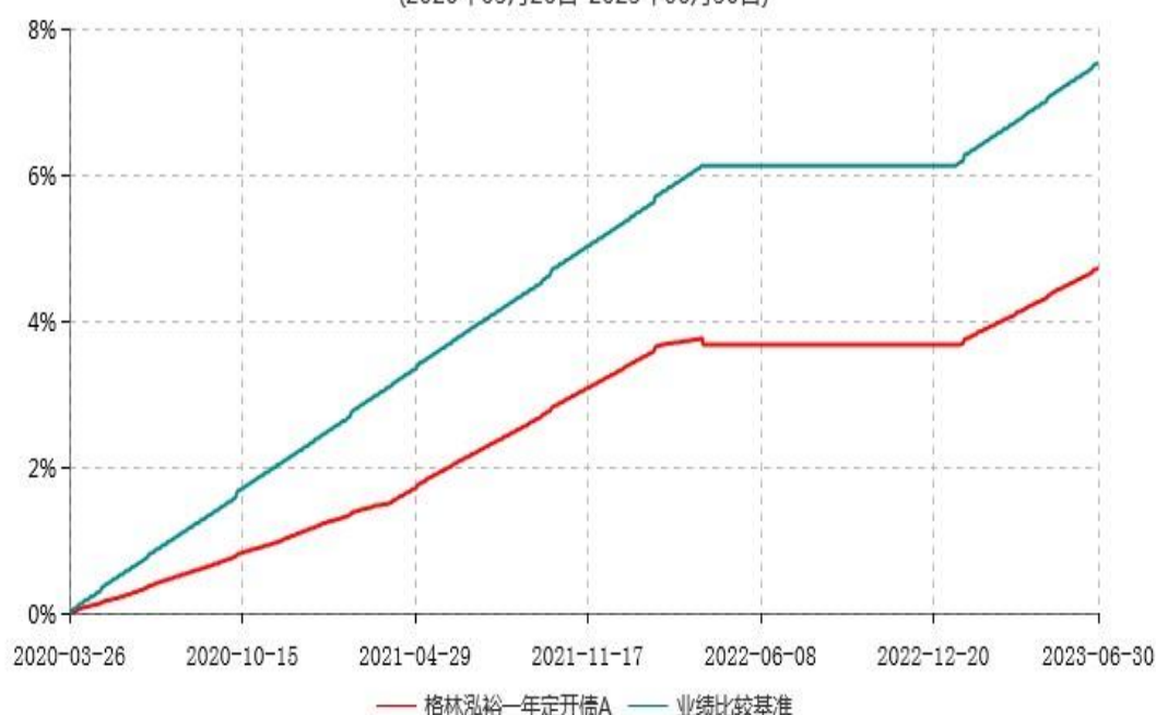
格林泓裕一年定开债A累计净值增长率与业绩比较基准收益率历史走势对比图 (2020年03月26日-2023年06月30日)

注：根据《格林泓裕一年定期开放债券型证券投资基金基金合同》约定，经向中国证监会备案，基金管理人于 2022 年 3 月 29 日发布《关于格林泓裕一年定期开放债券型证券投资基金第二个开放期到期后暂停运作、不进入下一封闭期的公告》，本基金于 2022 年 3 月 29 日起暂停运作。经与基金托管人协商一致，并报中国证监会备案，基金管理人于 2023 年 1 月 13 日发布《关于格林泓裕一年定期开放债券型证券投资基金恢复运作并开放申购、赎回及转换业务的公告》，本基金自 2023 年 1 月 13 日起恢复运作并开放申购、赎回及转换业务。份额净值增长率和业绩比较基准收益率均按实际存续期计算。